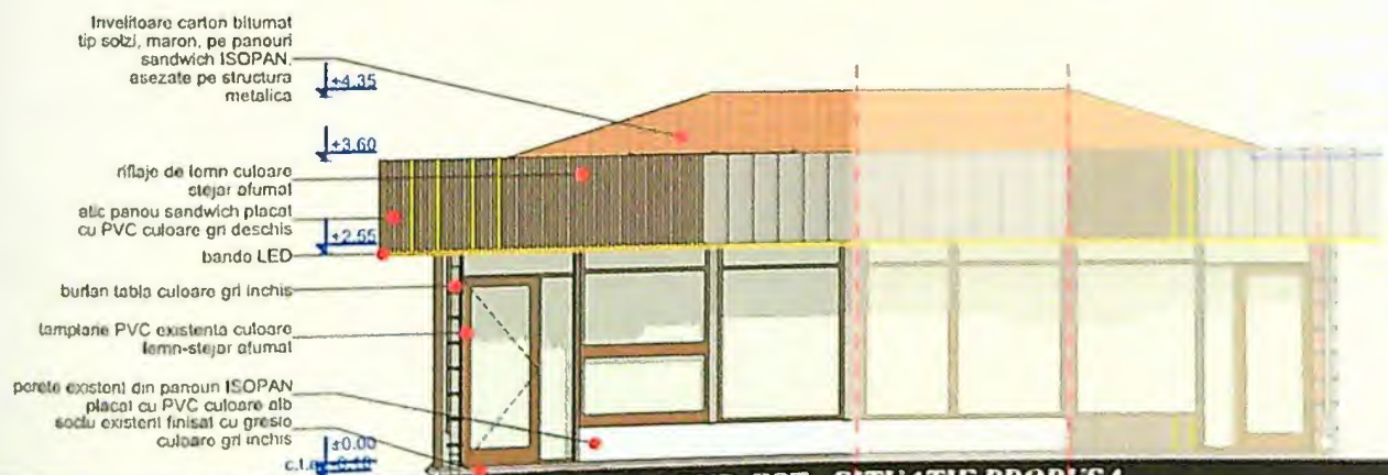
SPATIU COMERCIAL P - FATADA SUD-EST - SITUATIE PROPUSA 2.57 3.00 1 2