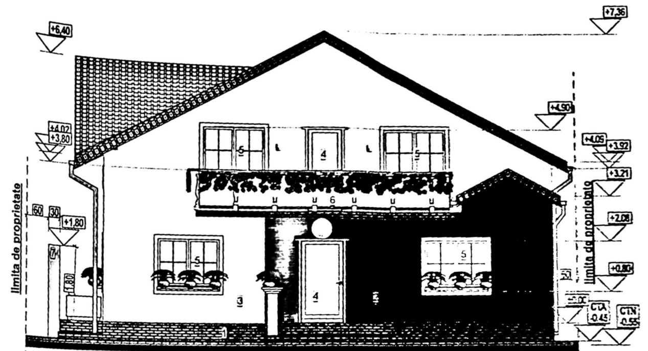
FATADA PRINCIPALA (DE VEST) Finisaje: 1-soclu impermeabil; 2-caramida aparenta rostita si lacuita; 3-tencuiala decorativa alba; 4-usi metalice albe cu geam securizat termozolant; 5-ferestre PVC alb cu geam termopan; 6-balustrada metalica alba cu poliglass qn; 7-panou opturator din lemn si osb placat cu polistiren extrudat.