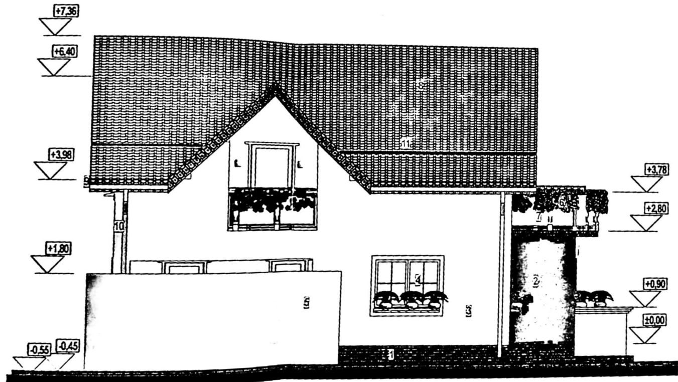
FATADA LATERALA (DE NORD) Finisaje: 1-soclu impermeabil; 2-caramida aparenta rostita si lacuita; 3-vopsea lavabila alba; 4-ferestra PVC alb cu geam termopan; 5-panou opturator din lemn si osb cu polistiren extrudat; 6-burlan; 7-caramida; 8-burlan.