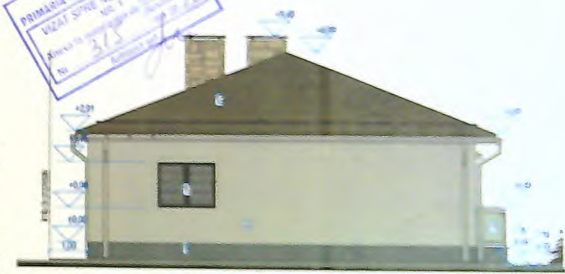
FACADA POSTERIOARA DE SUD-EST

JUDEȚUL BIAL PRIMĂRIA MUNICIPIULUI CRĂNDIDA VIZAT ȘI PE NE-SCHIMBATE Nr. 375 Data: 2018