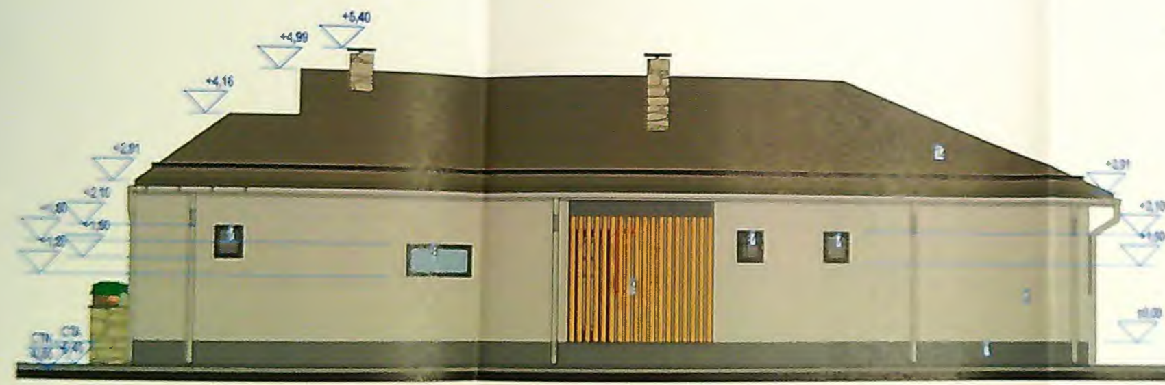
FACADA LATERALA DRAPTA DE SUD-VEST